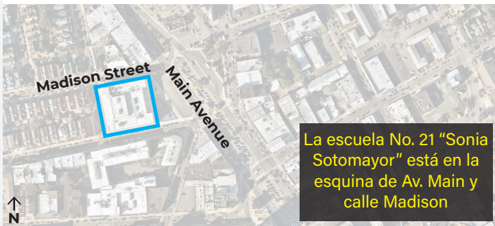
La escuela No. 21 "Sonia Sotomayor" está en la esquina de Av. Main y calle Madison